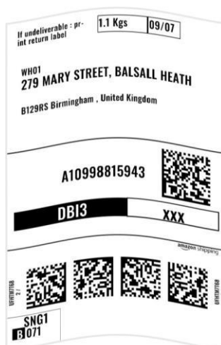
Étiquette pas sur une surface plane