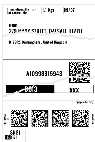
Étiquette ou code-barres endommagés