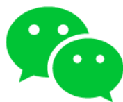
官方微信 亚马逊全球开店