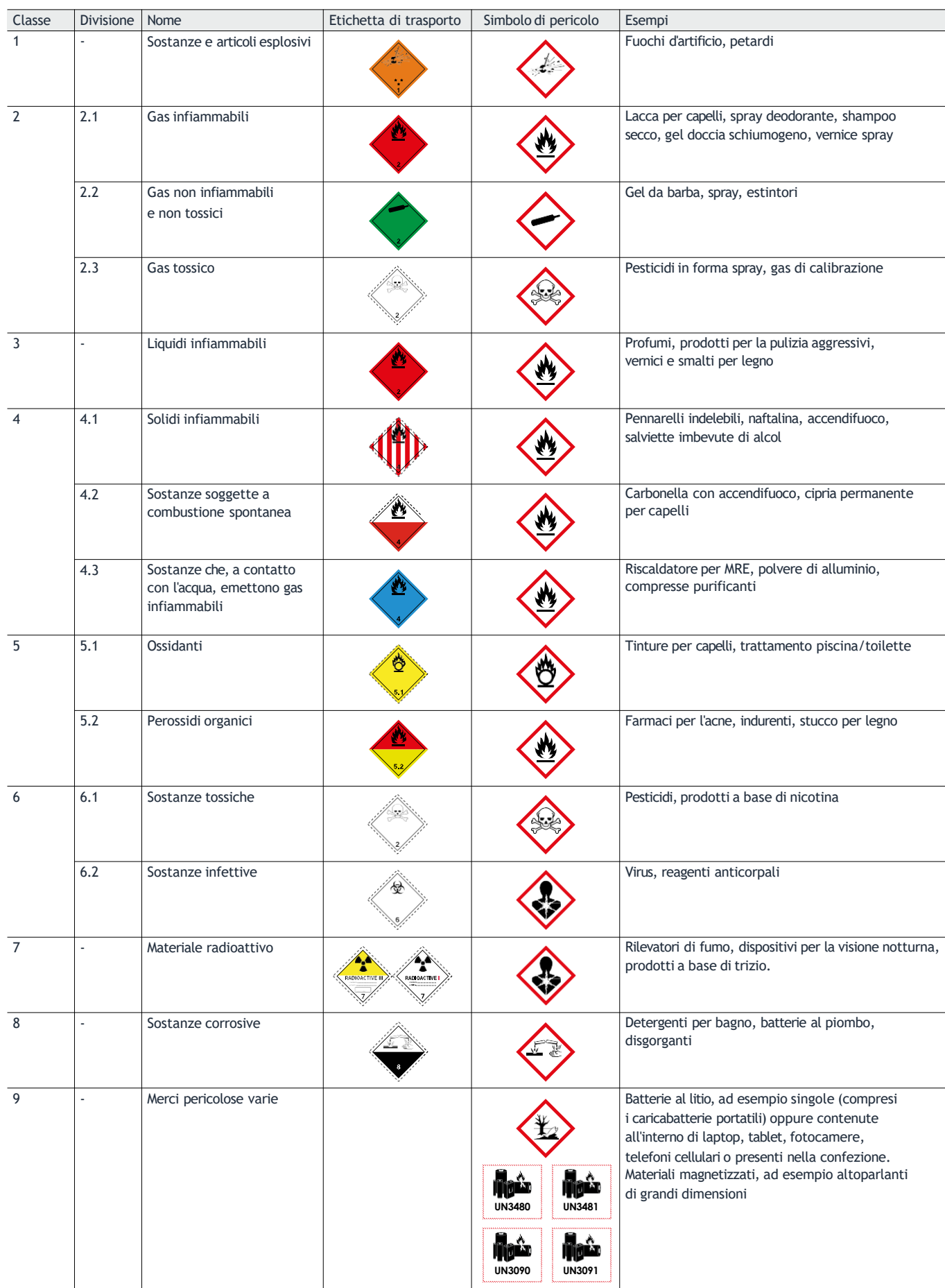
Tabella delle classi di merci pericolose