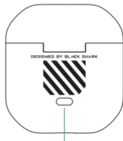
Pulsante di configurazione