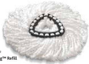
O-Cedar® EasyWring™ Refill