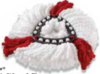
O-Cedar® EasyWring™ Power Refill

Para mejores resultados, cambie los repuestos cada 3 meses