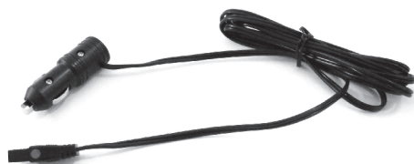
12V Power Cord Cordon d'alimentation 12V