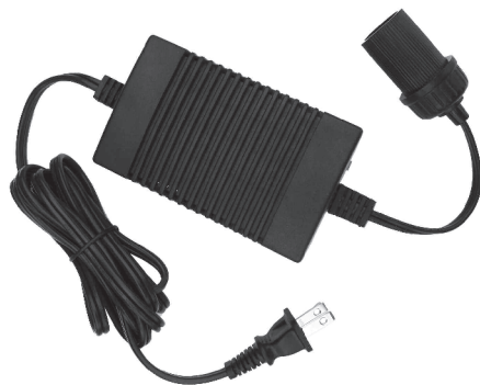
Power Pack Power Adapter Adaptateur de courant

Pour les prix et disponibilités, veuillez composer le : 1 800 265-8456