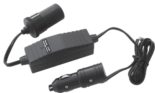
Battery Saver Économiseur de batterie